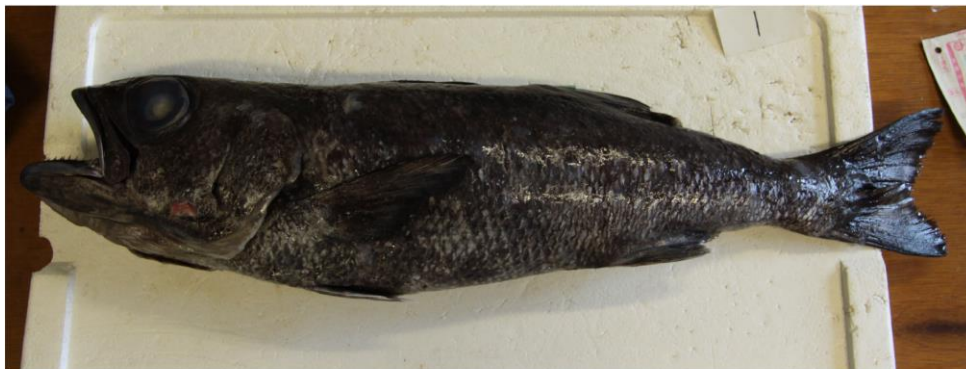
図2. 奄美近海で漁獲されたムツ属魚類の未記載種.